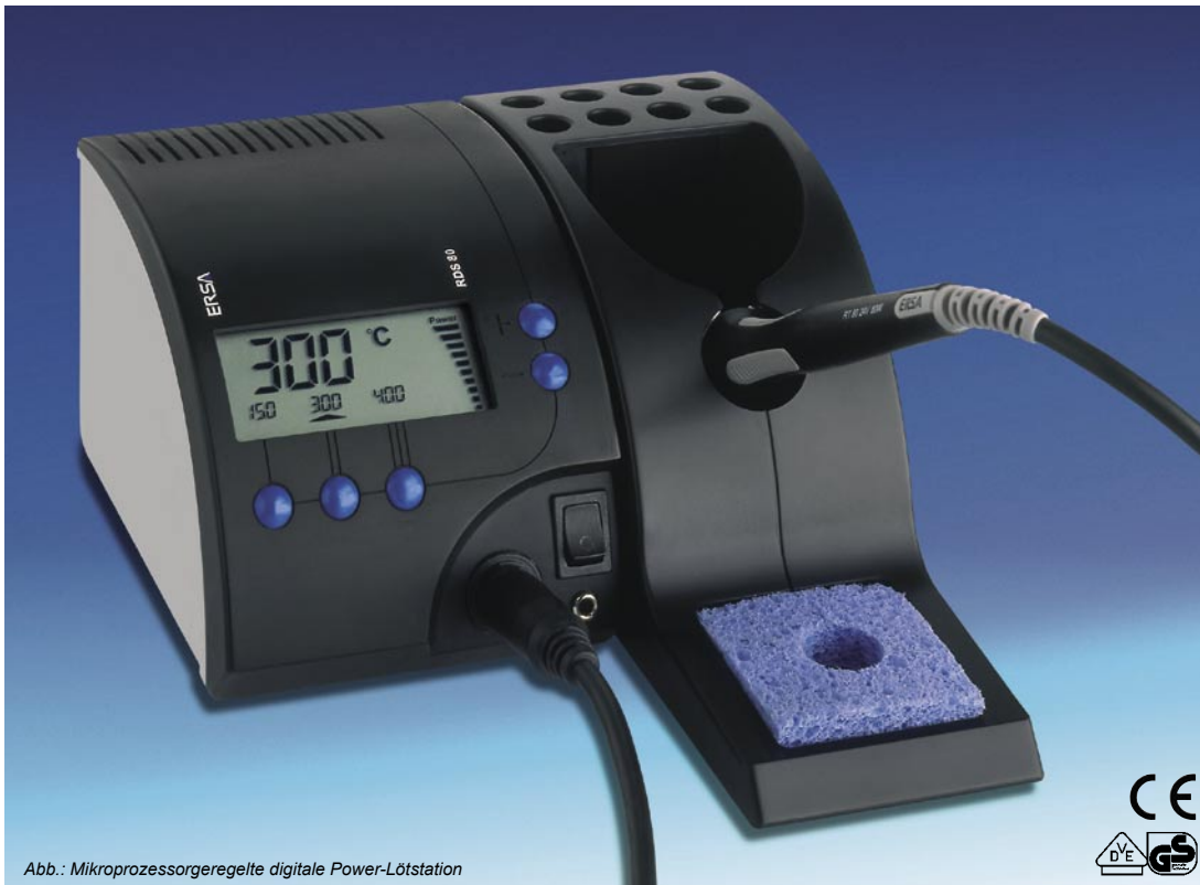
Abb.: Mikroprozessorgeregelte digitale Power-Lötstation